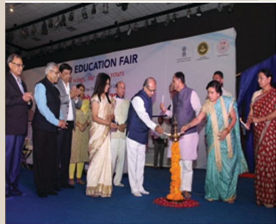
The Grand Education Fair-2018" provided the students with a platform which will allow the students well informed for pursuing further studies and taking up professions within the

"The Grand Education Fair" for the young students of Gujarat was organized by Knowledge Consortium of Gujarat (KCG) a division of Education Department, Government of Gujarat and Gujarat University from 02 nd to 04 th February,2018at Gujarat University Convention and Exhibition Center.