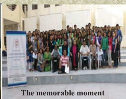
The memorable moment