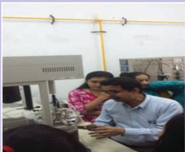
hands on Computer training – specifically in Excel and graphical presentation of results in our NRS

centre with the help of Computer department. A special session was conducted to motivate students and sensitize them about Entrepreneurship and Start up a very important initiative taken up by GUSEC.