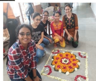
Rangoli with flowers