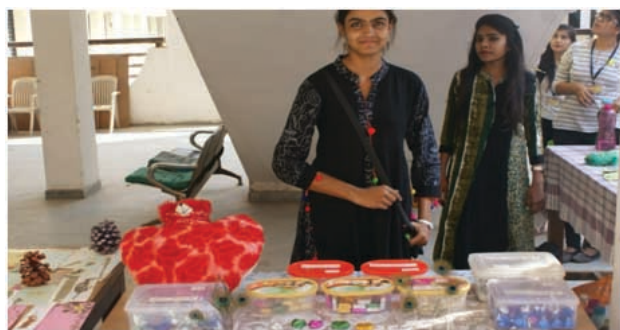
Home Made Chocolates on sale during the exhibition ARK Essence of Nature

The Members of Gujarat University Botanical Society (GUBS) welcomed the New Year with fun filled event EUPHORIA 2018 representing joy, happiness, delight, excitement and so on. Thus, the annual day's celebration began. The first day of the celebration began with sports. Nothing better than sports can keep everyone active. Relay race, lemon and spoon, book on head and chess were some of the sports that was enjoyed by everyone. The message day was celebrated in which each one had to write a message on the theme "friendship". The next day that was celebrated as talent day and students enthusiastically participated and won a lot many prizes. The activities included solo song, group song, mehndi competition, acting and mimicry. Group day was celebrated wearing smiley badges as a symbol of happiness. There was a seminar on Home Gardening and alongside a Rangoli competition was organized but the Rangoli's were to be made using flowers and leaves. The most awaited food festival witnessed enthusiastic participation from all. The various categories for all the delicacies were snacks, traditional foods, sweets, beverages etc. and a special category was there for innovative food items alongwith salad decoration and vegetable carving which