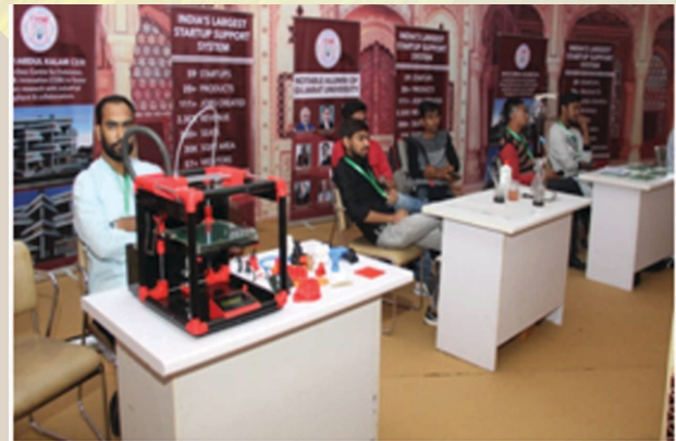
Patel, Hon'ble Minister Education Shri Bhupendrasinh Chudasama and special presence Hon'ble Minister of State, Primary and Higher Education Smt. Vibhavariben Dave.

"The Grand Education Fair" for the young students of Gujarat was organized by Knowledge Consortium of Gujarat (KCG) a division of Education Department, Government of Gujarat and Gujarat University from 02 nd to 04 th February,2018at Gujarat University Convention and Exhibition Center.