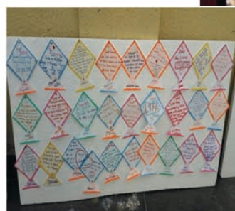
GUBS wall full of creative messages