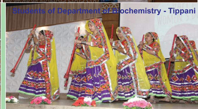
Students of Department of Biochemistry - Tippani