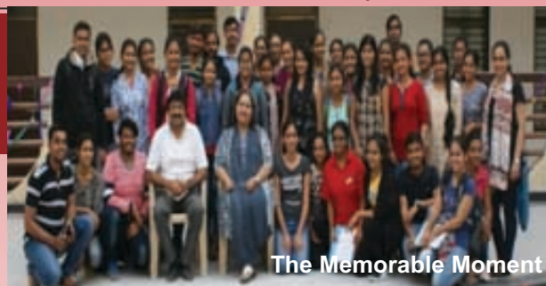
The Memorable Moment

were also placed in the competition. The Seminar ICE-TRAY was enjoyed by everyone, the seminar was followed with the best from the waste competition and was named as green day. The visible spectrum day was celebrated where the theme – NATURE was given for the competitions like painting, sketching, and scientoon drawing. Creative day was celebrated where students participated in videography and photography based on the theme – HAPPINESS. The seminar Phytoresources for a better tomorrow (PBT-2018) was also included as a day to appreciate the value of plant wealth and its utilization. Euphoria 2018 was concluded with executive and saree day where students and research scholars participated in the fashion show.